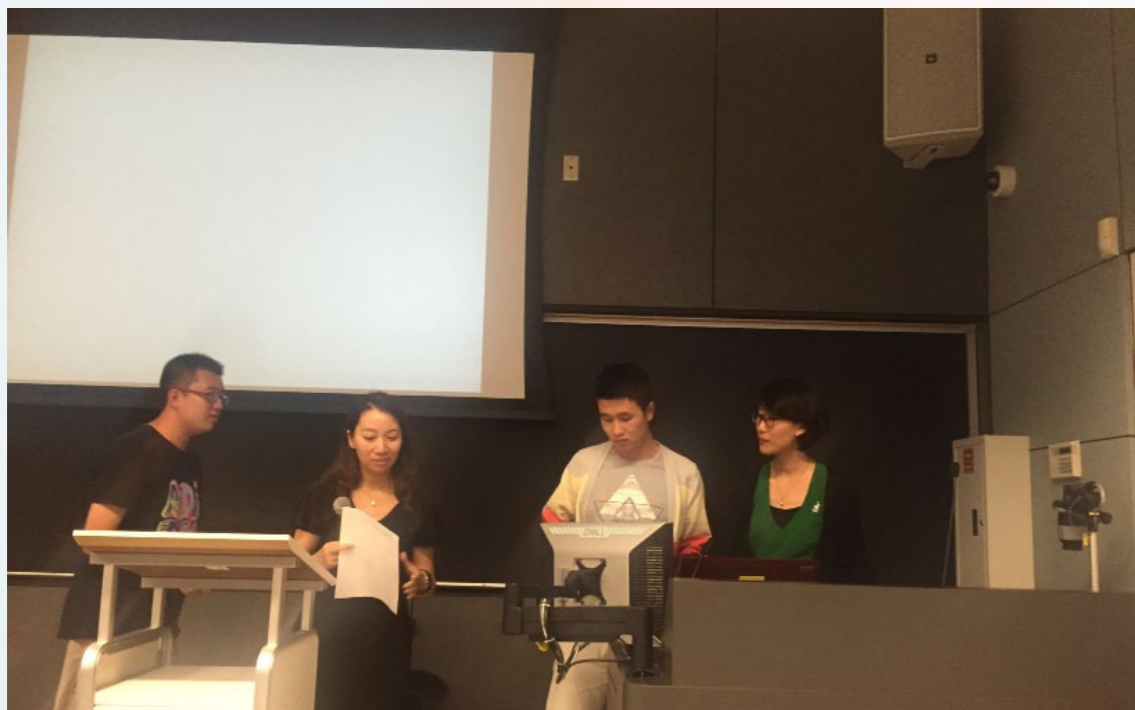
在最后的成果展示上，组员对项目进行展示和陈述。

附：增能模式应用于“失独家庭”的分析。可分为个体主动模式的增能和外部推动模式的增能：（1）个体主动的增能，包括个体心理的增能（如增强自尊心），个体素质的改变（人际关系和社会参与方面）。（2）对失独者团体的政治增能等外部推动模式的增能包括政府的增能，社会的增能和社区的增能等。