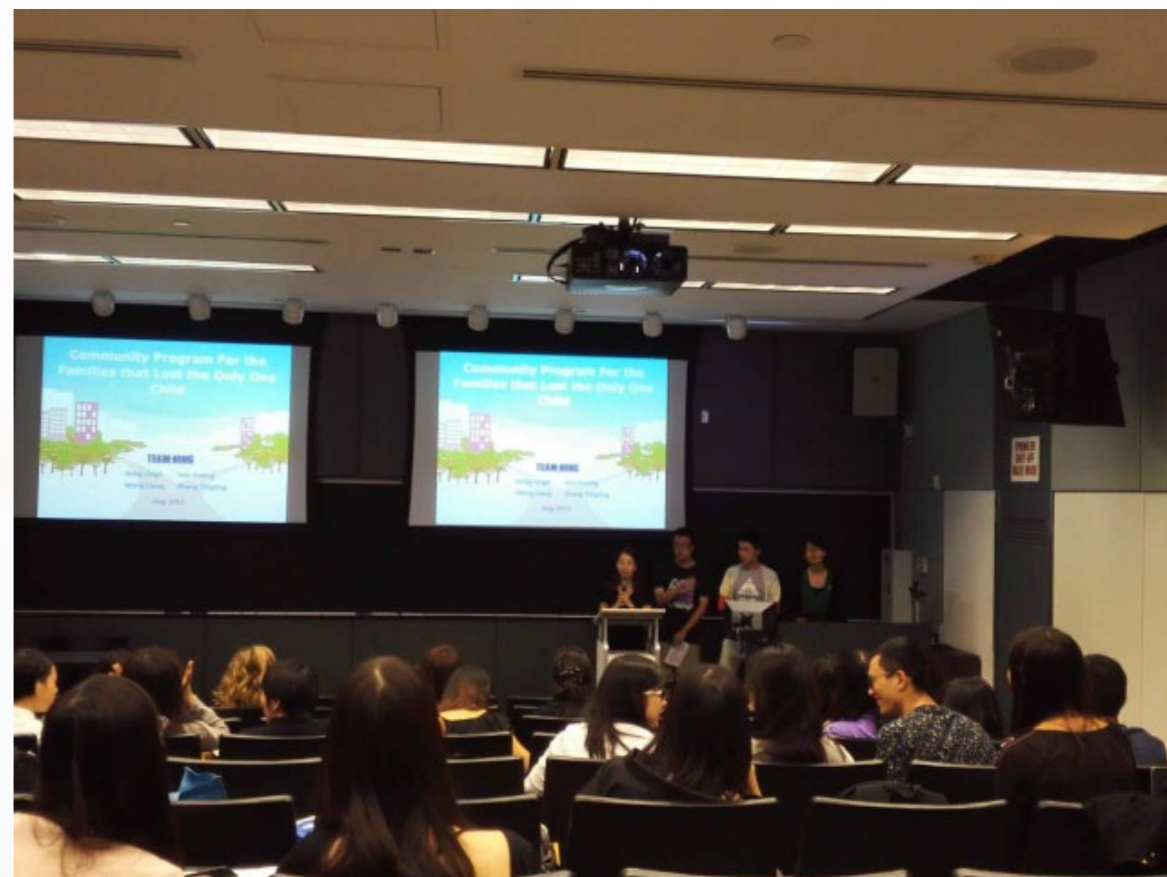
在最后的成果展示上，组员对项目进行展示和陈述。

准备工作基本结束后，就要进行各部分的整合，最终得出的成果——PPT。在展现之前，确定每人负责讲述的部分并进行反复演练，最后进行上台汇报。整个汇报过程是比较成功的，教授们也对我们的项目给予了认可。虽然只有短短的两周准备，整个过程却教会我们许多，不仅仅是专业知识方面，更多的是团队协作方面。每个人的努力汇集起来才成就了专业汇报的成功。