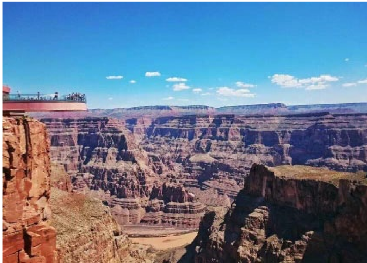
大峡谷一角 · 玻璃观光桥

悬崖的边上有些地方有栏杆，大多数地方则什么围栏都没有，据说是为了尊重印第安人的信仰，不给神赐予的大自然带来一丝一毫的伤害。不过，作为一个没有恐高症的年轻生命，置身于动辄上百米甚至上千米的峭壁边上，而脚下空空如也的时候，心中的不寒而栗也是油然而生。