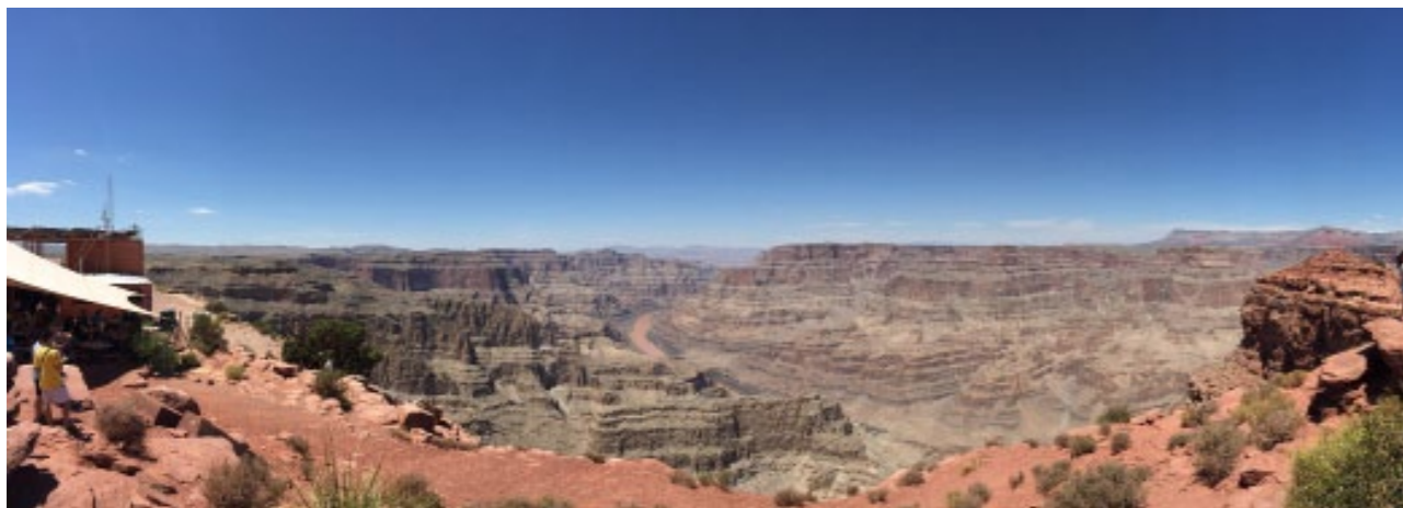
大峡谷全景 · 科罗拉多河

等一下，给我几分钟让我平静平静。我似乎无法用言语表达出我所看到的科罗拉多大峡谷，就在大峡谷出现在我眼前的一瞬间，我才发觉，之