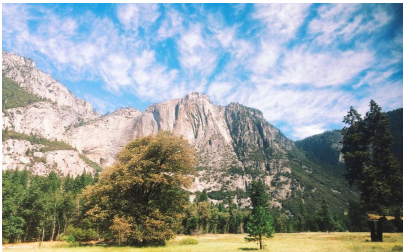
优胜美地国家公园风光

在为期两周的培训过后，学校安排了大家以一周轻松愉快却也十分充实的旅行结束为期三周的社工交流项目。旅游围绕美国西部三座最大的城市：洛杉矶、拉斯维加斯、和旧金山展开。前三天以拉斯维加斯作为据点，游览了赌城及大峡谷。接着马不停蹄的赶到了优胜美地国家公园领略自然的壮阔。最后三天沿着一号公路，从旧金山一路向南，游览美西海岸特有的景色。在这为期七天的旅行中，学员不仅领略到从沙漠到山区、从森林到海洋的自然景观，还观赏到了各地的人文景观，收获良多。