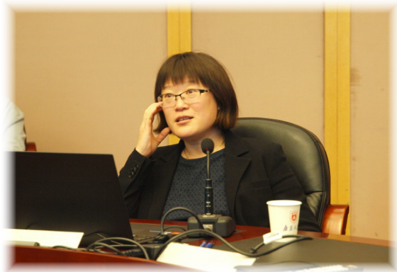
李秉勤副教授发言

2017年10月19日下午，应社会学院邀请，来自澳大利亚新南威尔士大学社会政策研究中心的李秉勤教授在南京大学社会学院合美堂“双社论坛”上，做了题为“社会信任、新公共管理与社会服务”的演讲。讲座由社会学院教授彭华民主持，社会学院、政府管理学院等60多名师生参与了论坛。